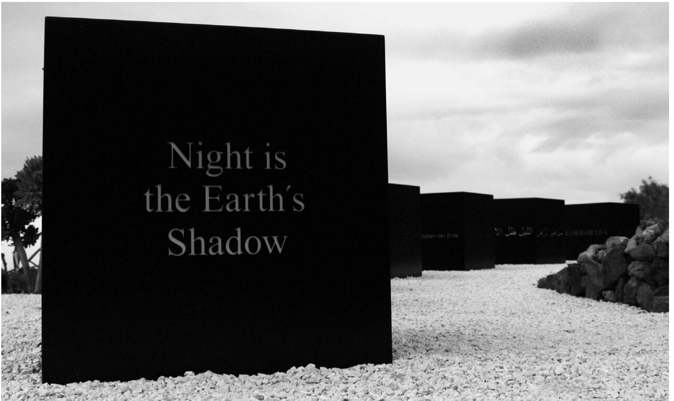
Skulptur von Vera Röhm.