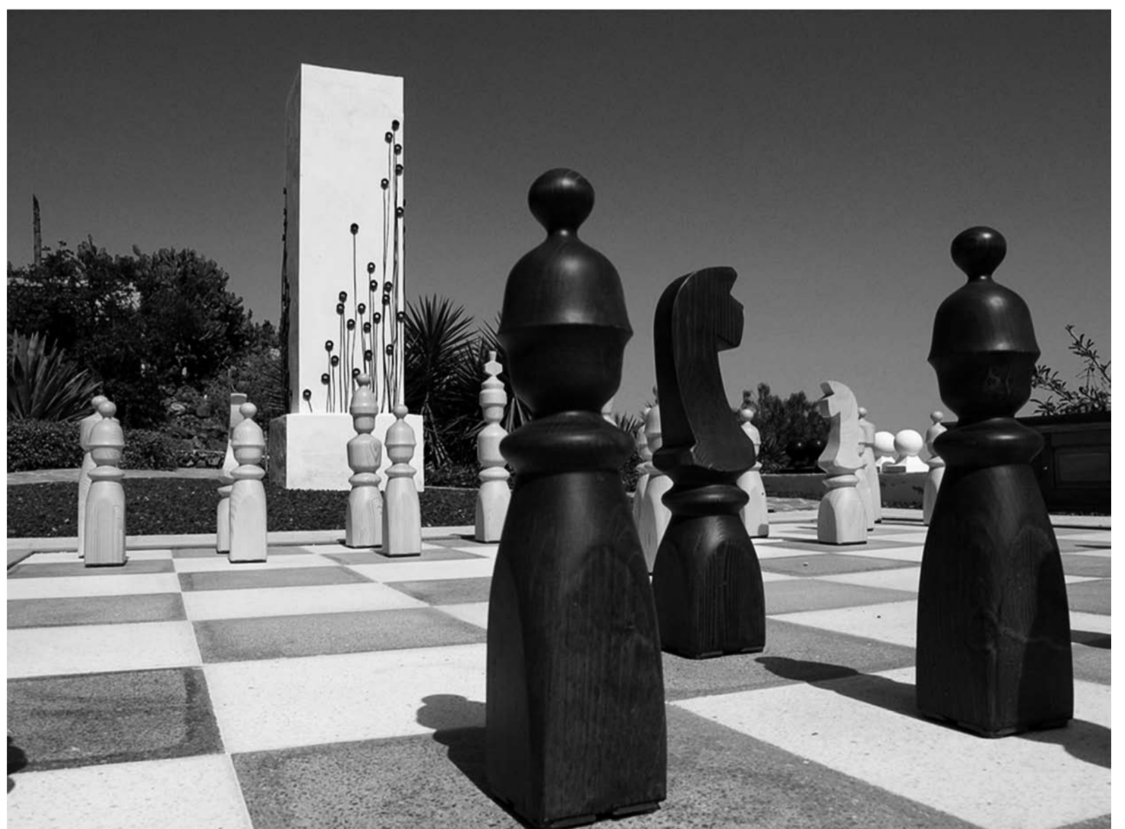
Schachplatz mit Klangsäulen von Robin Minard.