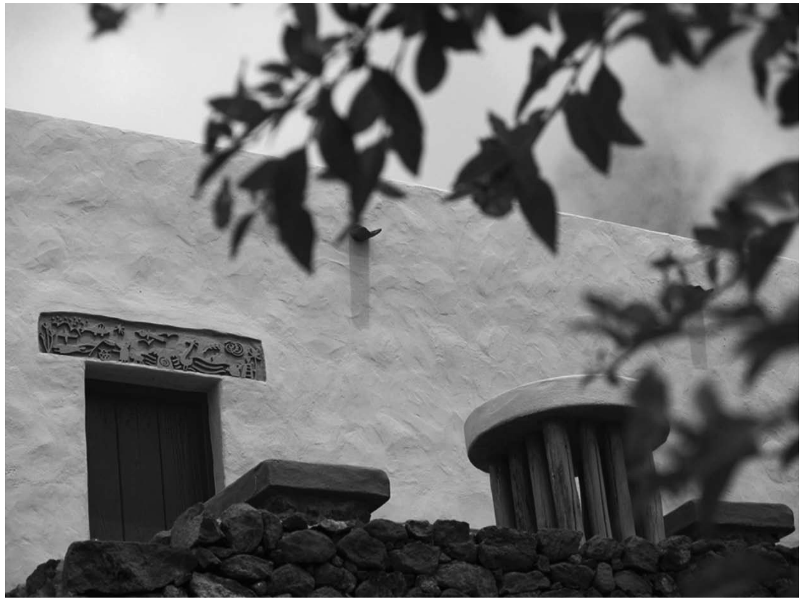
Sitzplatz vor dem Sternhaus.

HJM: Die Schöpfung ist auf Schönheit aufgebaut. Jede Pflanze, ja fast die gesamte Tierwelt, bezaubert durch ihre Schönheit. Das Fernsehen widmet zurzeit einem Eisbär-Baby viele Sende-stunden. Und der Mensch war in der Vergangenheit stets bemüht der natürlichen Schönheit eigene künstlerische Leistungen hinzuzufügen.