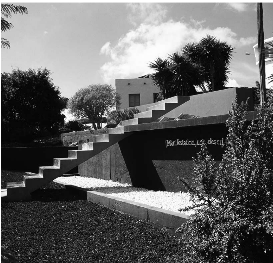
Galeria M – mit Arbeit von Joseph Kosuth.