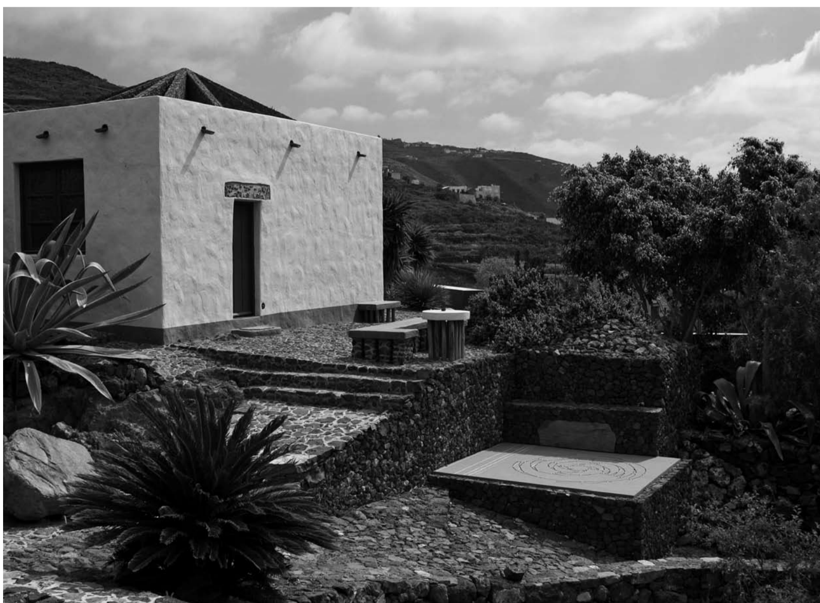
Gästehaus – Sternhaus.

kkb: Kunstunterricht in der Schule? Was würden Sie sich wünschen, wenn Sie Einfluss auf die Kunsterziehung in den Schulen hätten?