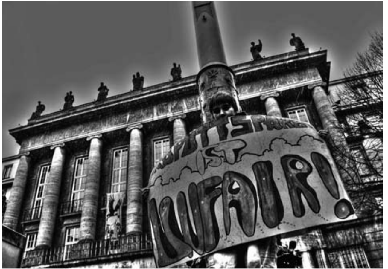
Pleitegeier am Rathaus Wuppertal